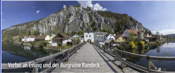
Vorbei an Essing und der Burgruine Randeck

A uf einem steil aufragenden Kalksteinfelsen über dem Altmühltal liegt die stolze Burg Prunn. Ihre majestätische Lage macht die Burg zu einer der bekanntesten Bayerns. Zudem ist sie Fundstelle der Prunkhandschrift des Nibelungenliedes. Fantastische Landschaften erwarten Sie auf dem Weg zum Luftkurort Riedenburg mit seinen romantischen Gassen und der majestätischen Rosenburg.